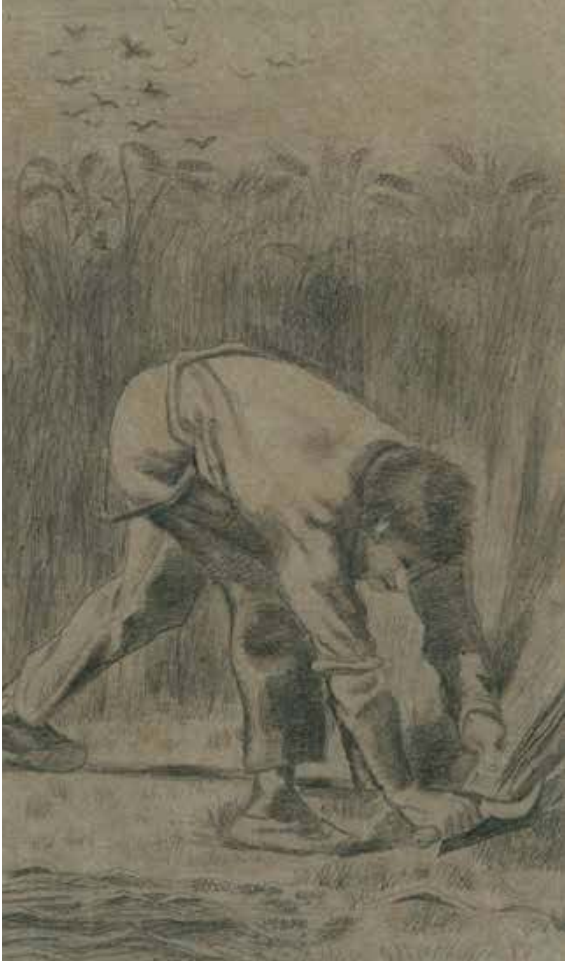
[links] Vincent van Gogh, De maaier met sikkel (naar Jean-François Millet), 1880, tekening, 55,5 x 30 cm Uehara Museum of Modern Art