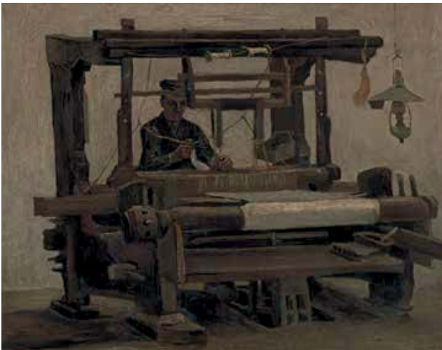
Vincent van Gogh, Weefgetouw met wever, 1884, olieverf op doek, 68,3 x 84,2 cm

Zijn oversten verlengden zijn contract niet, naar het schijnt omdat hij niet uit het hoofd kon prediken, maar de mijnwerkers herinnerden zich wel deze 'Christus van de kolenmijn' die zijn eigen lakens en hemd weggaf. Na een identiteitscrisis komt Van Gogh tot het inzicht dat alle grote kunstenaars diep religieus zijn en dat hij via de weg van de kunst God kan bereiken. In oktober 1880 verlaat hij de Borinage om zijn opleiding aan de Koninklijke Academie voor Schone Kunsten in Brussel aan te vatten, maar de expo toont dat Van Gogh de Borinage nooit meer heeft losgelaten.