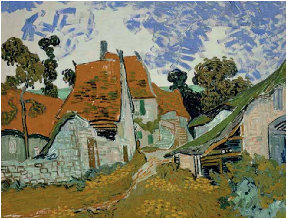
Vincent van Gogh, Straat in Auvers-sur-Oise, 1890, olieverf op doek, 73 x 92,5 cm Ateneum Art Museum Finnish National Gallery - Hannu Aaltonen

zijn. Curator Sjraar van Heugten bracht intussen al twee van vier volumes uit over de tekeningen van Van Gogh.