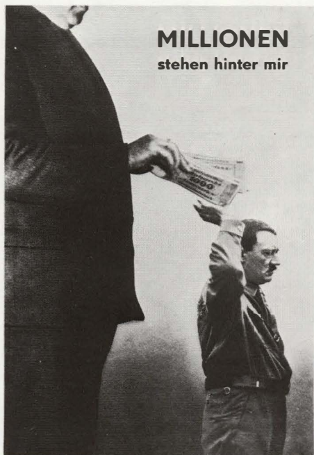
DER SINN DES HITLERGRUSSES