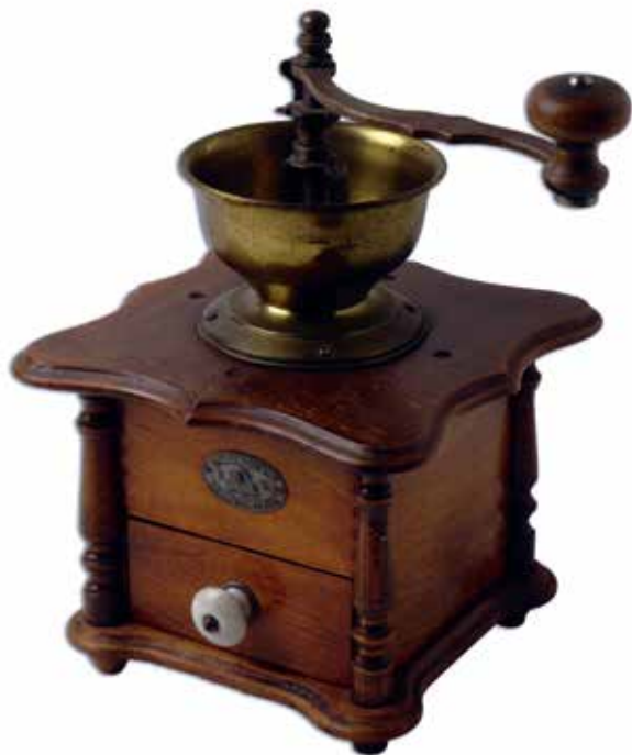
Een koffiemolen uit de tijd van toen: die staat dichterbij de toekomst dan we denken

dat we nog geen ‘roze doos’ hadden, die blijkbaar al sedert 1953 aan jonge moeders wordt aangeboden. Een oproep leverde een roze doos uit de jaren 1970 op met de inhoud intact.”