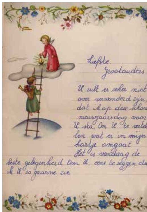
Een nieuwjaarsbrief uit 1958, bezoekers worden uitgenodigd om er nog eens één voor te lezen

collectiemateriaal te vinden is. En bij wie niet meer goed ter been is, komt het Huis van Alijn zelf op bezoek in woonzorgcentra met expo's op maat. 'Het huis van Alijn op bezoek: De Zesdaagse' over het baanwielrennen reist al sinds 2016 rond tussen woonzorgcentra. Vanaf 4 mei wordt het totaalpakket Kermis aangeboden. Misschien kan de plaatselijke fanfare langskomen of delen we majorettestokken uit de gebruikerscollectie uit? Met de BeleefTV, een Nederlands initiatief, is er ook een digitaal luik aan verbonden. Het is een grote tablet die ook door mensen in een rolstoel gemakkelijk gebruikt kan worden. Niet allerlei informatie doorgeven is het hoofddoel, wel de mensen iets laten herinneren."