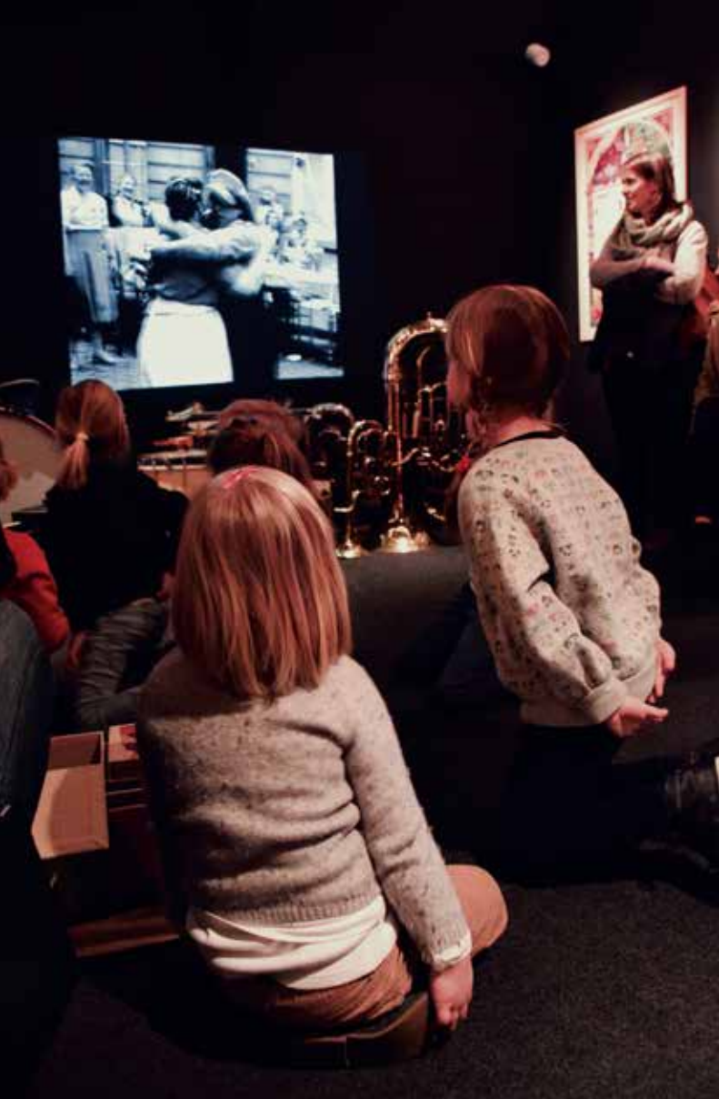
In elke museumkamer is een montage van Jasper Rigole te zien met fragmenten uit de collectie home movies