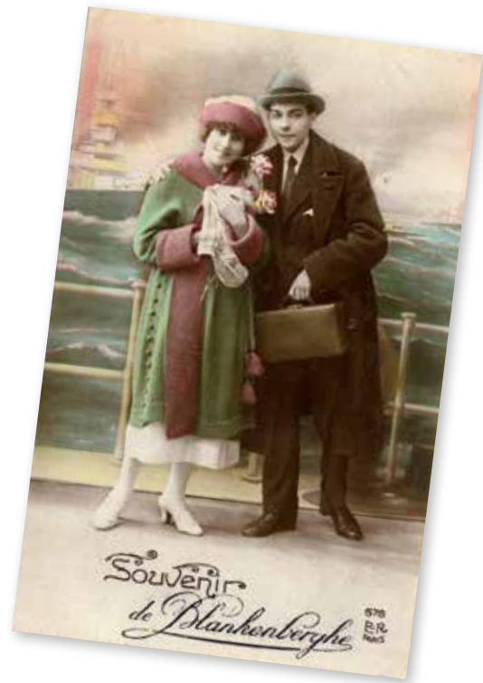
Oude foto's van geliefden wekken de indruk dat het er vroeger nogal preuts aan toeging, maar...

“Toch kunnen visuele prikkels nog altijd te veel emoties losmaken. We zijn nu eenmaal een museum van emoties. We hebben daarom bewust ook rustkamers voorzien waar geen